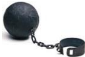
Niet uitvoerende bestuurders