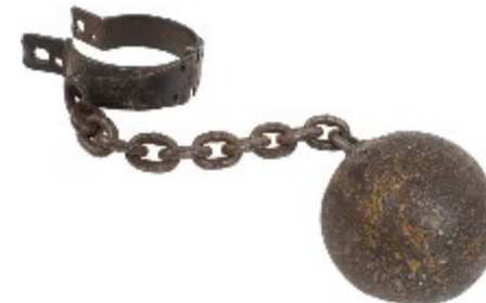
Lotsverbondenheid door beloning